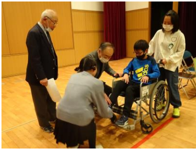
第一小学校5年生 車いす体験(左)・ボッチャ体験(右)の様子

協力いただきましたみなさま、ありがとうございました。なお、他小・中学校からも福祉教育の依頼をいただいています。参加予定のみなさま、ご協力のほどよろしく願います。