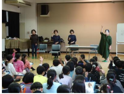
第一小学校4年生 レッツボランティアーの様子