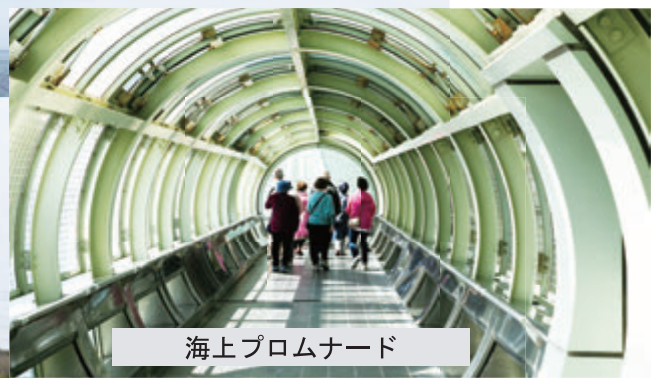
海上プロムナード