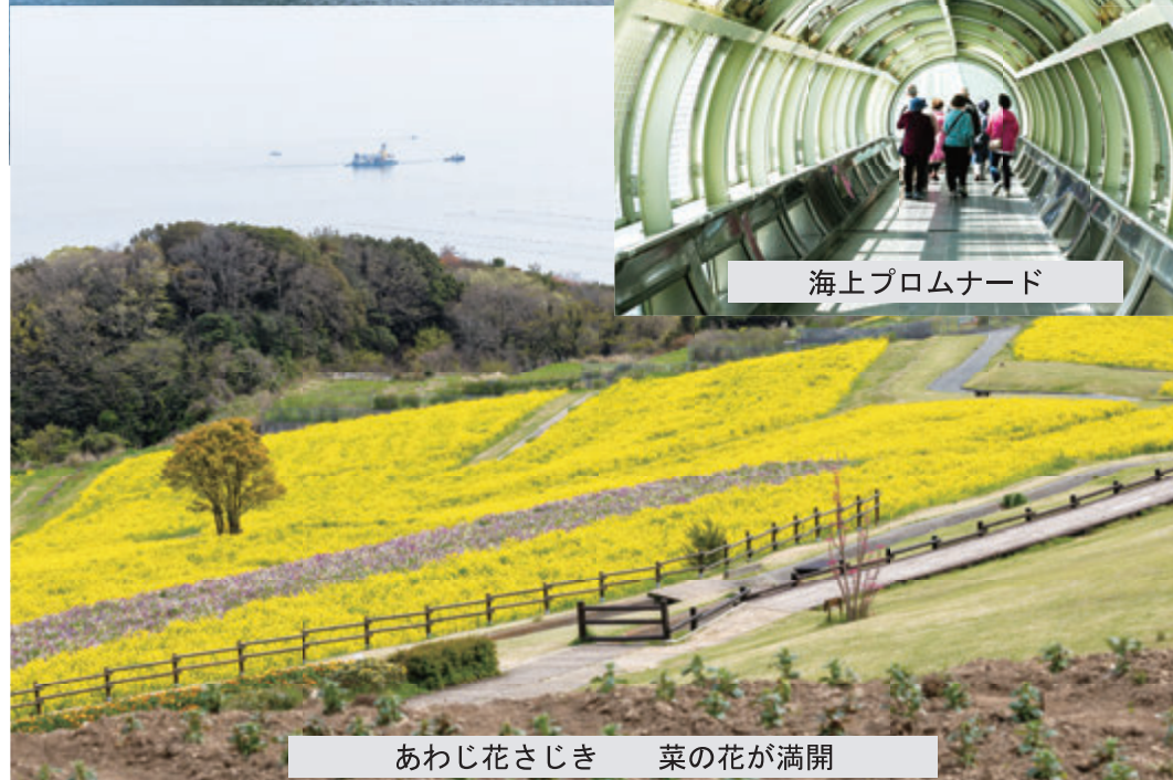
あわじ花さじき 菜の花が満開