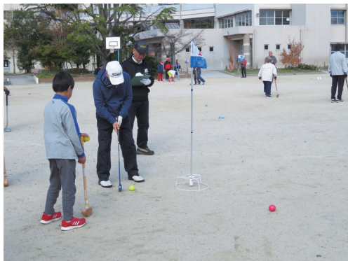
第二小学校にて 11月30日 62人