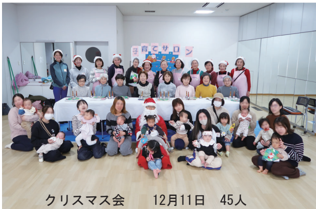
クリスマス会 12月11日 45人

メゾン水無瀬年長者クラブのミュージックベルに合わせて「あわてんぼうのサンタクロース」「きよしこの夜」を一緒に歌った後は、サンタの登場です。一人ずつプレゼントをもらい、子どもたちはニコニコ。サンタの膝の上に座ってハイ、ポーズ。撮影会が始まります。モテモテサンタもデレデレです。少し早いクリスマス会でしたが、楽しいひと時を過ごせました。