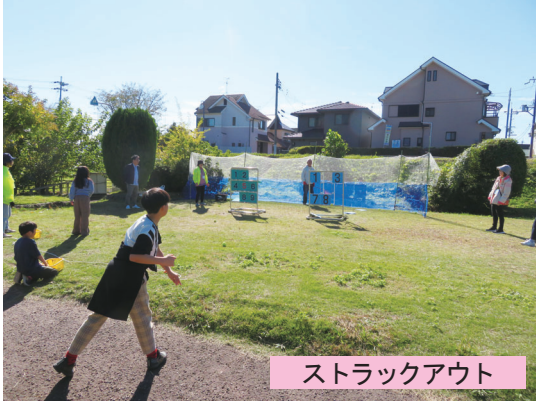
ストラックアウト

私が担当したストラックアウトのコーナーでは、大人顔負けの剛球を投げ込む子どもがおり、将来大谷選手のようなプロ野球選手になるのではないかの思いがしました。また親子連れでボールを投げる姿は大変微笑ましく感じました。